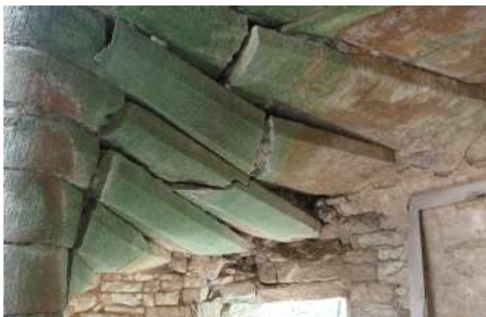
Les dernières marches ici en 2015 avant l'étaie-ment devenu urgent.

Pour la sécurisation, il s'agira de la stabilisation des maçonneries du XIX ème siècle, de la consolidation du mur des latrines et du remplacement et/ou brochage de marches d'escalier. Enfin, pour limiter les intrusions, les portails nord et ouest seront restitués.