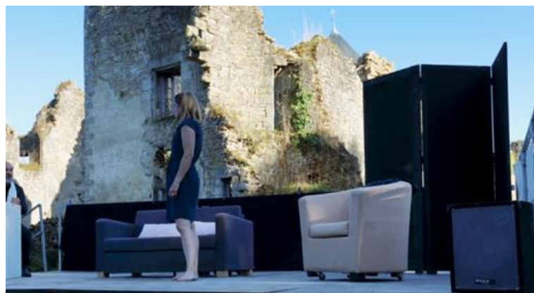
Petits crimes conjugaux de E.E SCHMITT. Compagnie: Les Uns sans C d'Orée d'Anjou

L'audience s'est révélée en deçà des espérances. Malgré la richesse de l'offre tant amateur que professionnelle ainsi qu'une communication décuplée, une météo aqueuse sans retenue, a été en partie à l'origine d'une fréquentation restée dans les normes habituelles.