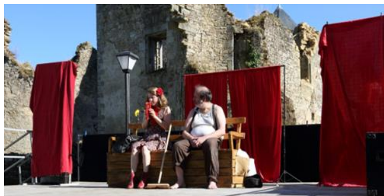
Demain peut-être, création. Compagnie: DeuFoiZin de Fougères